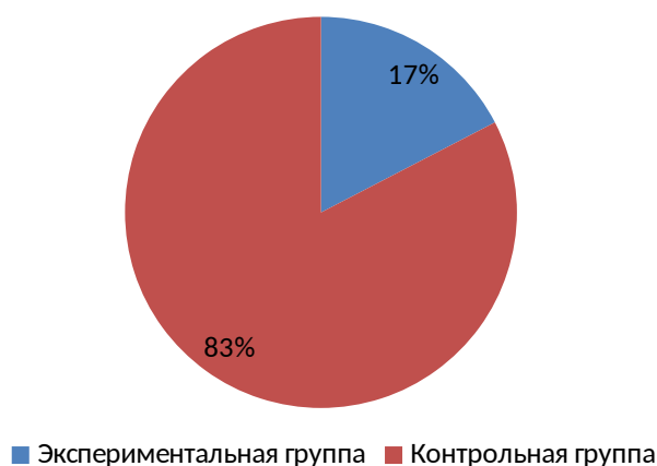
Рисунок 2. Успешность восприятия на слух слов квазимонимов в экспериментальной и контрольной группах (в %).

Пример оформления рисунка представлен ниже.